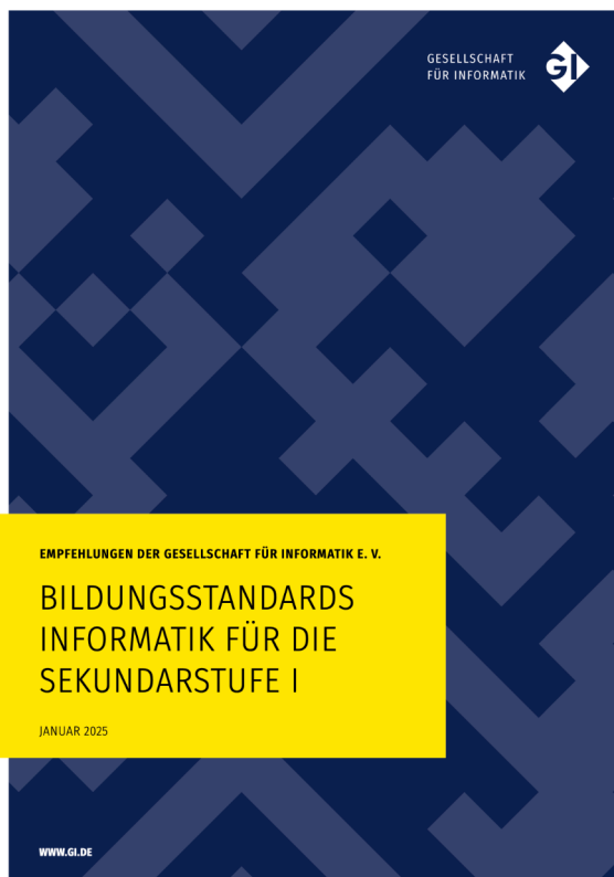
Abbildung 2: Titel der Bildungsstandards Informatik für die Sekundarstufe I

Wir gehen davon aus, dass die neuen Bildungsstandards für die Sekundarstufe I einen ebenso positiven Einfluss wie die bisherigen Empfehlungen auf die Lehrpläne für Informatik in den Bundesländern haben und den Unterricht im Schulfach Informatik in den nächsten Jahrzehnten prägen werden.